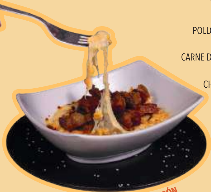
MAICITOS CON CHICHARRÓN