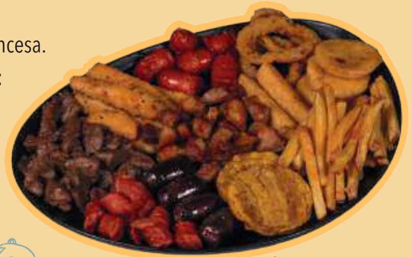
PICADA PARA 4

Carne de res, filete de pollo, chicharrón, chorizo, salchicha, morcilla, acompañada de papas a la francesa, yuquitas, patacón, arepa y cebolla crispy.