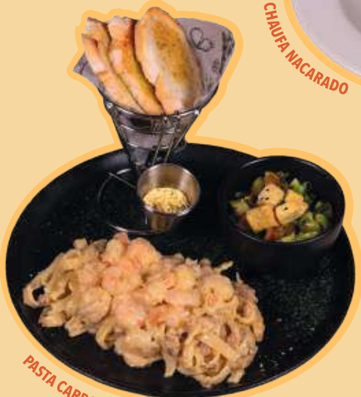
PASTA CARBONARA CON CAMARONES