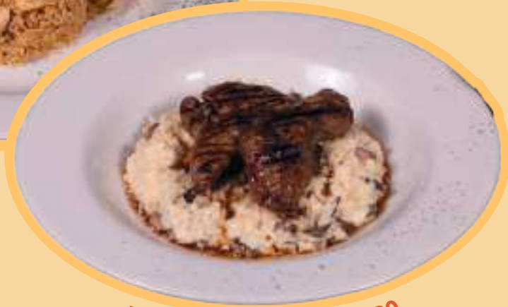
RISOTTO DE SETAS ALMENDRADO