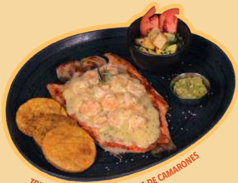
TRUCHA CON SALSA GRATINADA DE CAMARONES

300 gr de suprema de pollo, acompañada de chimichurri.