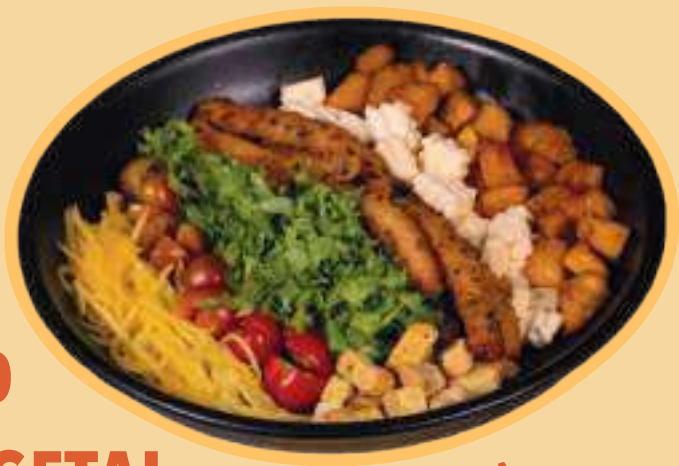
CREA TU ENSALADA

TODAS LAS ENSALADAS LLEVAN CROTONES Y ADEREZO $33.500