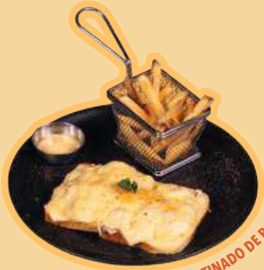
SANDWICH GRATINADO DE POLLO

NUESTROS SANDWICH VIENEN ACOMPAÑADOS DE PAPAS A LA FRANCESA