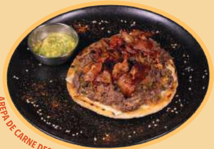
AREPA DE CARNE DESHEBRADA CON TOCINETA