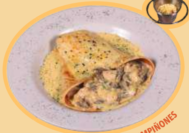
CREPE DE POLLO Y CHAMPIÑONES